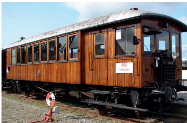
SB M 2 - HØNEN - på Mariager station.

Selvom man starter livet som personvogn oven i købet med træsæder og ikke selv kan køre, men skal trækkes af et lokomotiv, kan man godt ende sine dage som en fin motorvogn, der kører ved egen kraft.