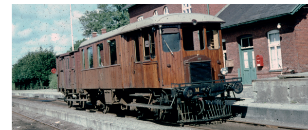
M 1 på Sæby station 1967 med tog mod Aalborg.

Efter krigens omfattende kørsler med gengas var benzintmotorerne slidt op, og i 50'erne forsynedes begge vogne med en Leyland dieselmotor, som de bibeholdt i resten af deres tid hos Aalborg Privatbaner.