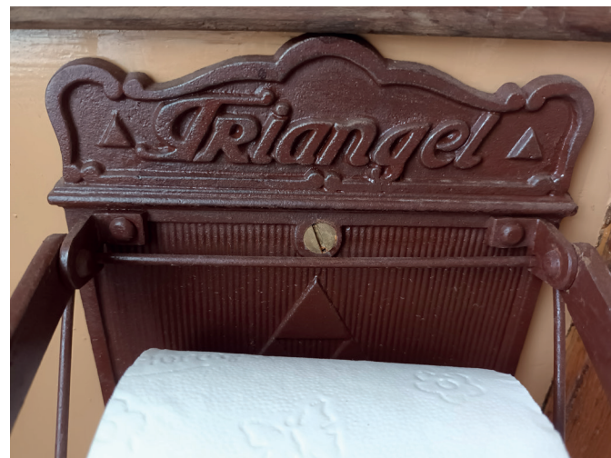
Triangel kæde for detaljerne. Toiletpapirholderen har fabrikkens monogram

Veteranbanen råder over to Triangelvogne, bygget som nogle af de sidste på fabrikken i Odense i 1937 og 1939.