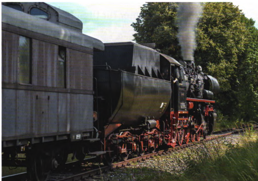
52 8168-8 foran vores udflugtstog på vej mod Nördlingen i nærheden af Marktoffingen.

begge, da en kæmpe asteroide ramte jorden for 14,3 mio. år siden. Find evt. Nördlingens turisthjemmeside på nettet og se det flotte luftfotografi. Det var en lille sidehistorie, som jeg synes er ganske spændende at kende.