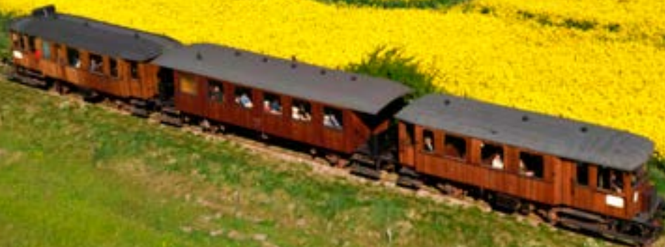
Mariagre Handest veteranbane på vej mod Handest.