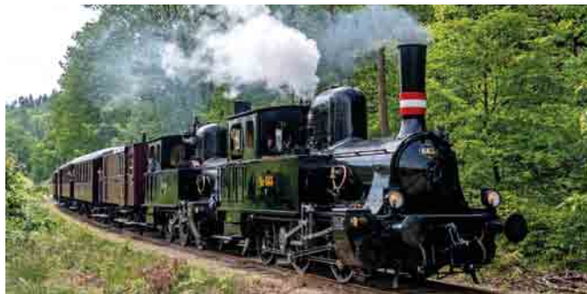
Simon Mosbjerg Mørch

Ingen veteran togskørsel sommeren 2024. Kørsel mellem Haderslev og Vojens med materiel fra Sydjyllands veteran tog.