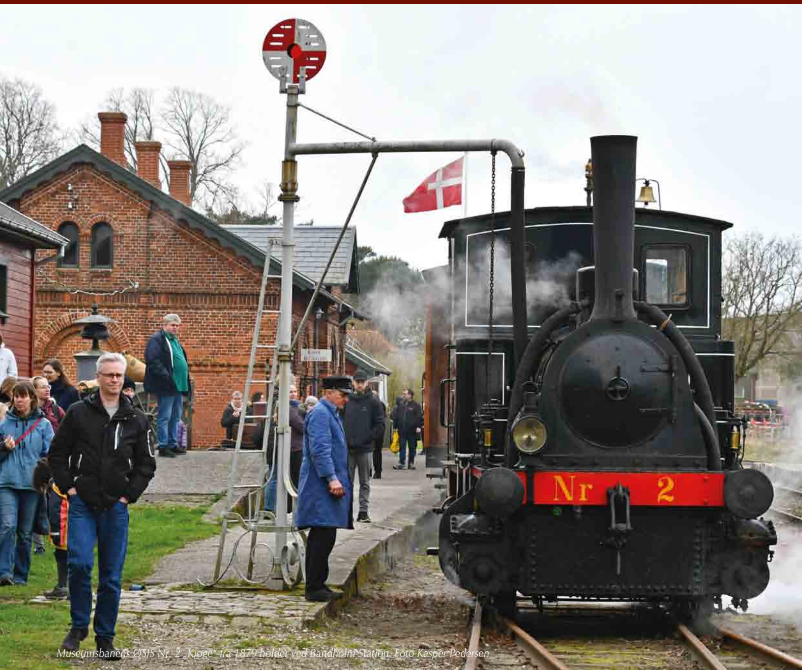
Museumsbanens ØSJS Nr. 2 „Kjøge“ fra 1879 holder ved Bandholm Station.